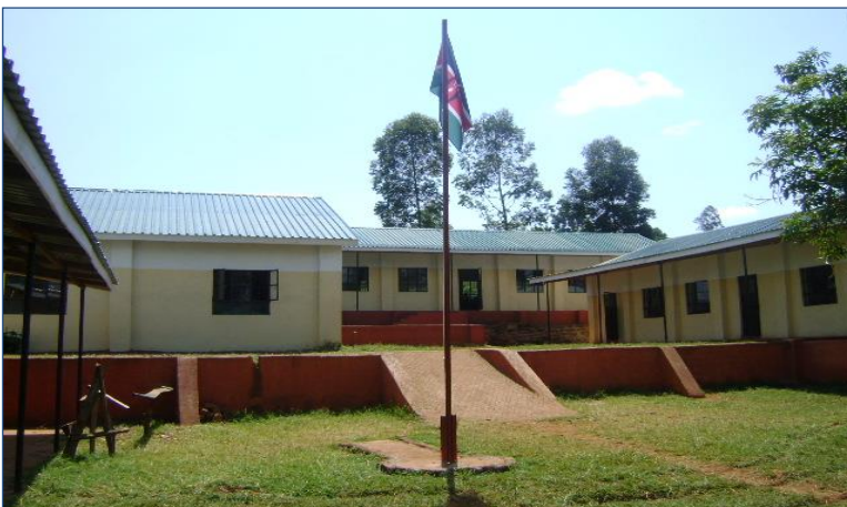
De lagere school

De school is een voorbeeld in de regio op het gebied van dienstverlening, discipline en goed georganiseerd onderwijs. De school heeft in totaal 19 ruimtes, verdeeld in 12 klaslokalen, 4 kantoorruimtes, 1 lerarenkamer/conferentiezaal, 1 computerruimte en een bibliotheek. Er zijn twee categorieën leerlingen die worden toegelaten tot de lagere school: de weeskinderen van het weeshuis en kinderen van de omgeving. We kunnen gelukkig zeggen dat door middel van de lagere school Blessed Generation Nyamira dichterbij de gemeenschap is komen te staan.