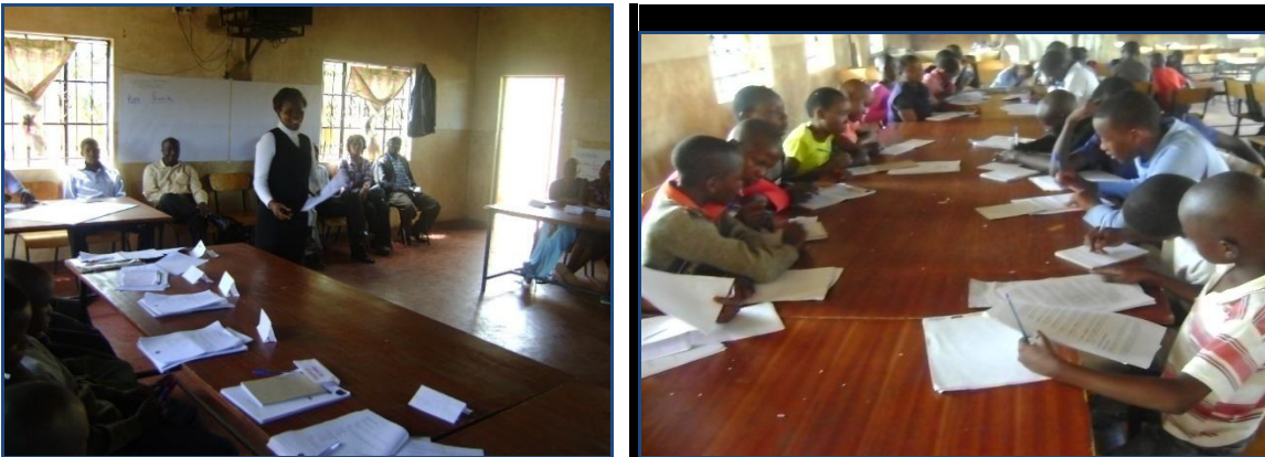
Het evenement in volle gang in de eetzaal van Blessed generation Nyamira, 4 april 2013

De kinderconferentie van de provincie Nyamira werd gehouden in het weeshuis van Blessed Generation. Dit is een jaarlijks seminar waar kinderen over een breed scala aan onderwerpen leren, zoals loopbaanplanning, HIV en culturele invloeden met als doel bewustwording en voorbereiden op de toekomst. De coördinator van de kinderbescherming uit de provincie Nyamira deed de aftrap van het evenement. Speciaal geselecteerde kinderen uit de hele provincie kwamen samen met de kinderen van het weeshuis en woonden het evenement bij. Het hoogtepunt van de bijeenkomst was dat de kinderen verwend werden met cadeautjes, als versterking van wat de kinderen geleerd hadden. Het evenement duurde drie dagen en werd georganiseerd door het kinderdepartement met steun van de organisatie World Vision.