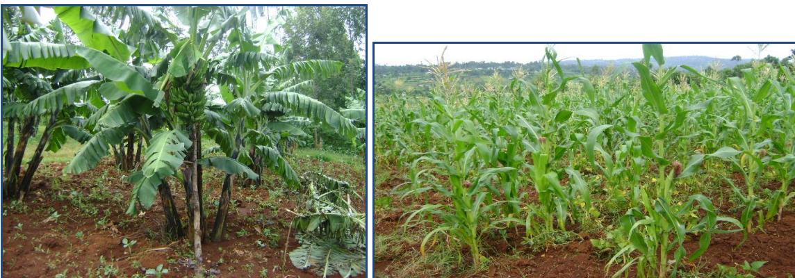
Sukuma wiki (soort kool), bananen en mais op het land van Blessed Generation Nyamira

In de landbouw zijn we afhankelijk van regen. En sinds maart hebben we een flinke betrouwbare hoeveelheid neerslag gehad. Echter, dit jaar heeft het tussen april en half mei nog flink geregend. Hierdoor is helaas ook een deel van de gewassen, voornamelijk groenten, vernietigd. De tuin in Nyamira is gelegen op een vrij steile helling op de onderste regio van het perceel. Dit veroorzaakt bodemerosie bij zware regenval.