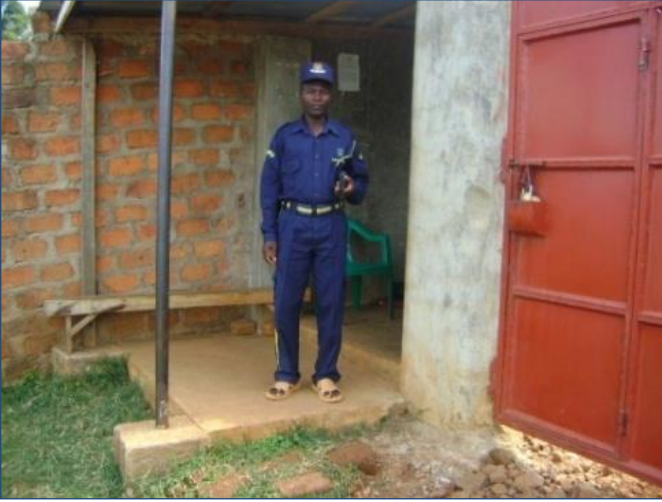
Een bewaker bij de hoofdingang van Blessed Generation Nyamira

Het weeshuis wordt bewaakt door Ranger, een beveiligingsbedrijf dat 24 uur per dag bewaking biedt. Dit zorgt voor continue veiligheid van de kinderen en het weeshuis en er wordt niets aan het toeval overgelaten.