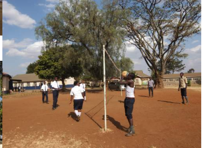
Naar 'voor tieners'