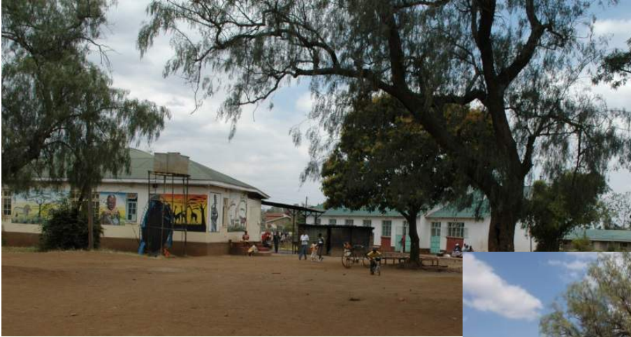
Van 'voor kinderen'