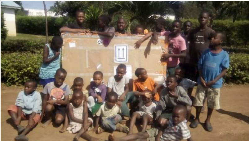
De eerste zending van 2 smartboards is aangekomen

We zoeken sponsoren die ons willen helpen de verzending per post van de smartboards te betalen. Kosten: circa 1000 euro per zending van 2 smartboards.