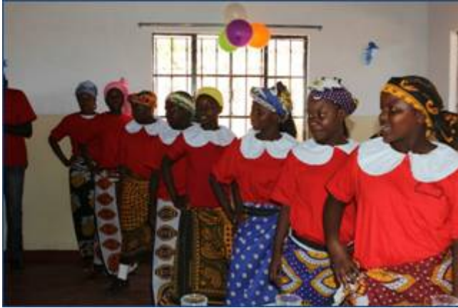
Een muziektoneelstuk door kinderen uit Malindi