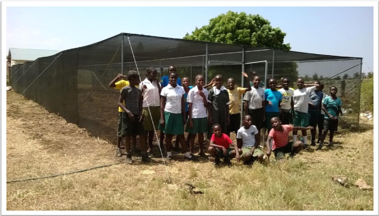
Foto: de kas in Malindi

We blijven continu op zoek naar manieren om minder afhankelijk te worden. Eén van de projecten op dit gebied is landbouw op de weeshuisterreinen. In januari is zowel in Ruiru als in Malindi een kas gebouwd. In februari zullen mensen getraind worden voor het werk in de kassen. We hopen op deze manier bijvoorbeeld genoeg tomaten te hebben voor de weeshuizen zodat we die niet meer hoeven kopen. In Ruiru is ook een waterdruppelsysteem aangelegd om sukuma goed te kunnen verbouwen. (Sukuma is een soort van spinazie en de dagelijkse groente voor de kinderen.)