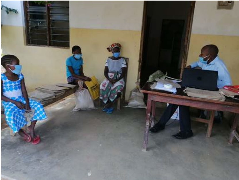
de mogelijkheid met de docent contact te hebben