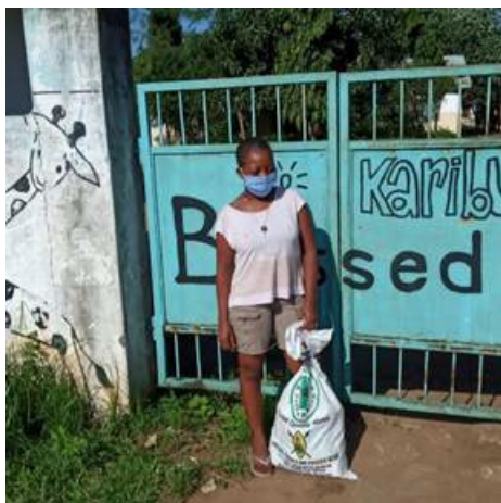
Student gaat hulpgoederen wegbrengen

De kinderen worden thuis bezocht en soms is er ook telefonisch contact.