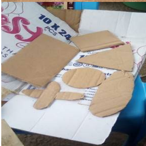
Creatief thuisonderwijs: Wiskundige vormen