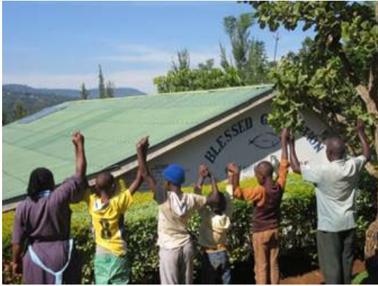
De drie nieuwe kinderen welkom bij Blessed Generation

Op voorschrift van de regering zit de deur bij Blessed Generation potdicht. Niemand mag er in en niemand mag er uit. Maar wil dit dan zeggen dat er plotseling geen kinderen meer wees worden? Wil dit zeggen dat er plotseling geen hulp meer nodig is voor kinderen? Nee, niets is minder waar. De vraag om opvang van kinderen blijft gewoon bestaan. Blessed Generation heeft dan ook drie nieuwe kinderen mogen verwelkomen.