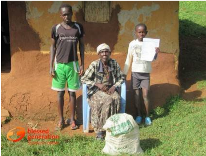
Kinderen bij hun opa hebben zojuist hulpgoederen ontvangen

Een groot aantal gezinnen hebben daardoor geen geld voor eten en al helemaal niet voor zaken als bijvoorbeeld zeep.