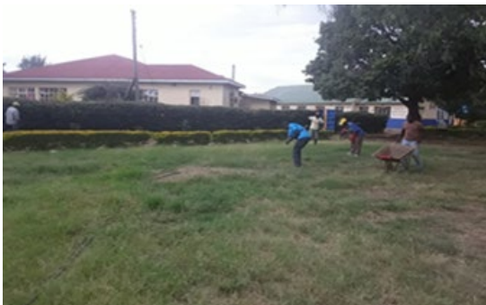
Blessed Generation docenten onderhouden het terrein

Al deze werkzaamheden gaan door. Vele handen maken licht werk. Wat een creativiteit en flexibiliteit zien we bij iedereen.