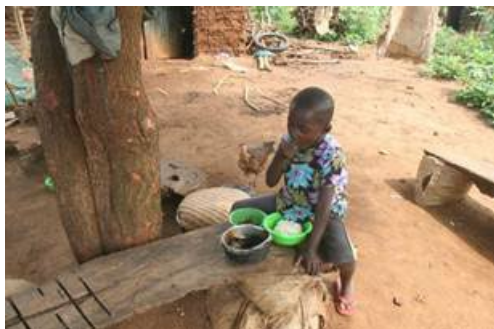
Kind in de thuissituatie aan het eten

De kinderen van Blessed Generation wonen zo veel mogelijk bij familie of personeel van Blessed Generation.